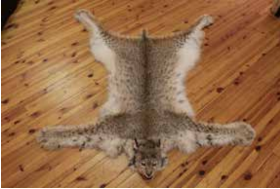
ILVESE NAHK 139,83 CIC punkti Priit Paomees Soome, 2016