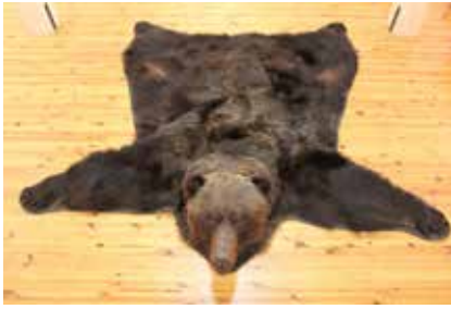
KARU NAHK 321,56 CIC punkti Timo Vaaramaa Venemaa, 2015