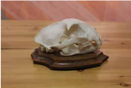
ILVESE KOLJU 28,28 CIC punkti Raldi Vellau Lääne-Virumaa, 2015