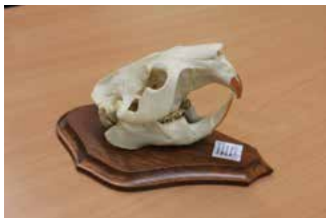
KOPRA KOLJU 28,15 CIC punkti Peeter Viil Raplamaa, 2016