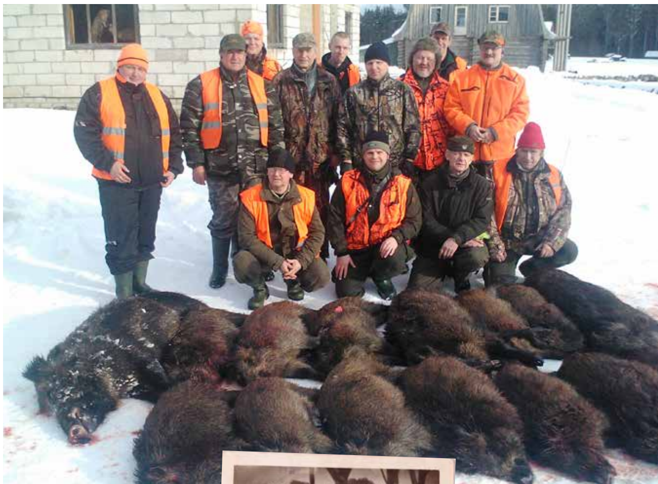
Seajaht 2017. aasta talvel.