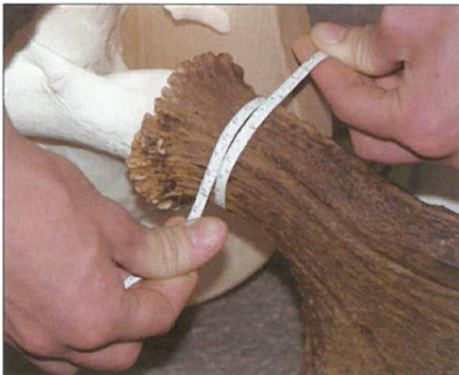
Joonis 12. Sarvetüviku ümbermõõdu mõõtmine.

Tüvikute ümbermõõt – mõõdetakse tüvikute kõige peenemast kohast, kuid piiksarvedel mitte kaugemalt kui 6 cm sarve kannasest (lk 2). Mõõt esitatakse võimalusel millimeetritäpsusega. Tüviku ümbermõõdu võtmiseks sobib peenike painduv mõõdulint või näiteks rätsepa mõõdulint.